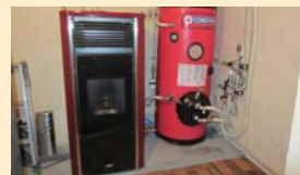
床暖房や給湯用など家庭用のボイラー。炎を楽しめるストーブタイプもあります。