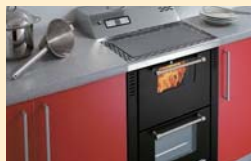
オープン機能も備えたペレットのキッチン。