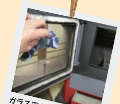
② ガラス面が焦げてきたら、炎が見えづらくなるので、たまに水拭きしましょう。