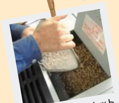
③ 燃料タンクに京都ペレット(10kg)を投入。柄付きザルを使うのがオススメです。