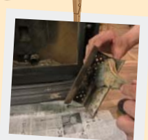
① 点火する前に灰トレーの確認。そしてホットを取り出し軽く灰をハケで落とします。