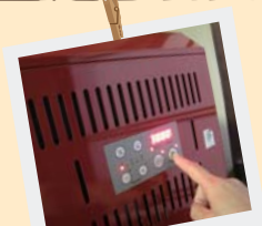
④ あとはスイッチON! ファンが動き出して5~10分で着火! 燃料は自動供給。