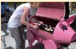
アウトドアでBBQなど楽しめます。