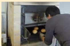
パンを焼くための窯のバーナーがペレット仕様。