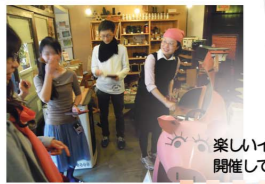
楽しいイベントも開催しています。

あたたかくて優しい火の良さを見直し、木を使うことで森を元気にしたい。その思いを形にするため、京都の森とまちをつなぐアンテナショップとして京都ペレット町家ヒノコが誕生しました。森林・環境に関わる方や興味ある方はもちろん、どなたでもご利用いただけます。