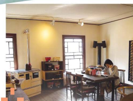
イベント会場として貸し出しもしている2階サロン