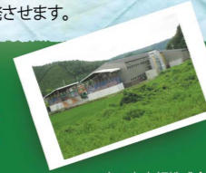
森の力京都株式会社